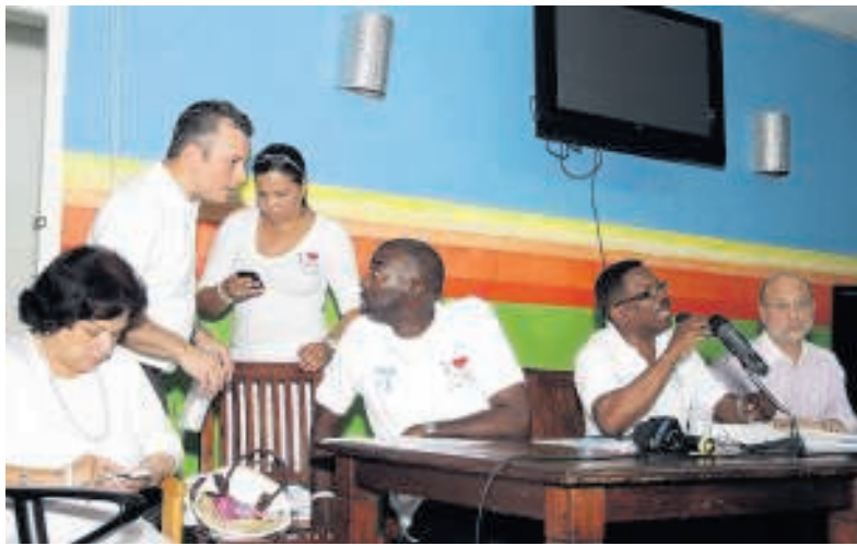
Demissionair premier Schotte (tweede van links) belegt een persconferentie, nadat hij Fort Amsterdam heeft verlaten.

Pueblo Soberano bleek intussen niet erg gelukkig in haar rol van coalitiepartner. Binnen twee jaar heeft